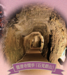
龍潭寺開歩 (石見銀山)

2026.5.23 土 記念ゴルフ大会・前夜祭 (島根ゴルフ倶楽部) (ホテル一畑)