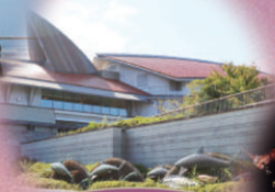
しまね海洋館アクトス