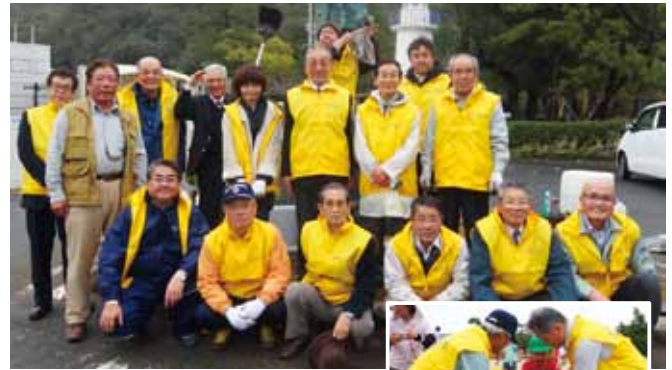
4R-1Z 玉野渋川ライオンズクラブ 「今期のアクティビティ」

平成27年6月12日（金）17:00より国道431号海側の松林（弓ヶ浜白砂青松21b）にて草刈・清掃活動を行った。 この活動は豪雪で被害を受けた国道431号沿いの松林の保全のため、鳥取県が各種団体から弓ヶ浜松林の里親となる「弓ヶ浜・白砂青松そだて隊」を募集し、松林の継続的な保全活動に取り組むもので、我がクラブもその1団体として定期的に草刈・清掃活動を行っている。 従来の草刈・清掃活動に加え、今年2月2日（日）にはクラブ認証55周年記念事業の一つである「松の苗木植栽事業」として松苗木100本を植樹した。 今回は植樹後初めての草刈・清掃活動であったが、自分たちで植樹した松の生育状況が気になり、松林を大事に思う気持ちがより深くなったと感じている。 今後も「我が子」の成長過程を確認しながら松林の保全活動に取り組んでいきたい。