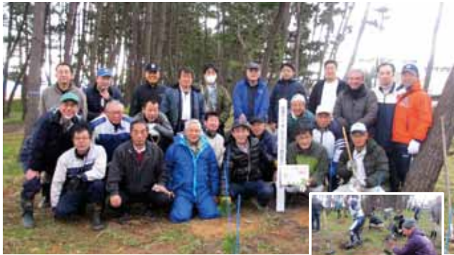
8R-2Z 境港ライオンズクラブ 「白砂青松アダプトプログラム草刈・清掃作業」 日時：6月12日（金） 場所：国道431号沿線弓ヶ浜松林

「固い絆で 広げよう奉仕の輪」の今期スローガンに沿って、アクトを実施していきます。先ず、福島県田村市との絆を大切に復興支援を続けます。我々の支援アクトで子どもたちの体力が戻ってきています。セブンスチャレンジャップという少年サッカーの支援。毎年その参加者が増え、前期は県内外から約600名の少年たちが汗を流しました。未来の日本を背負う子どもたちに支援を続けます。岡山大学の学生と周辺の大学生たちが「岡山バトン」という組織をつくり、学生だけで復興支援を続けています。バトン、まさに繋ぐという意味で、復興支援を繋いでいます。夏と冬、福島県と宮城県の子どもたちを招き、合宿と地元岡山の子どもたちとの交流をしています。「おかえり」が合言葉です。若い大学生のパワーをもらいながら支援をつづけます。スローガン通り、メンバー同士の絆、福島との絆、336B地区の絆、世界との絆、そして我が支部「絆支部」の絆を大切にしながら、奉仕活動を続けていきます。