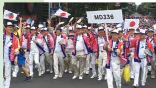
ピンク色のハッピーを着て行進するMD336のメンバー