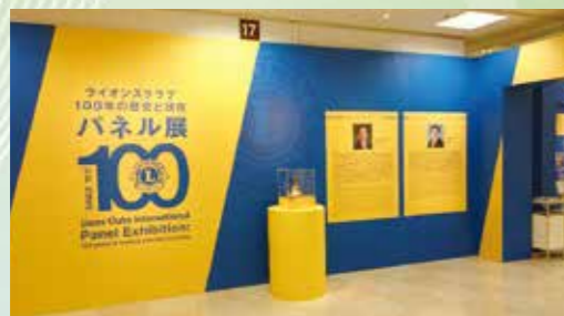
ライオンズクラブパネル展