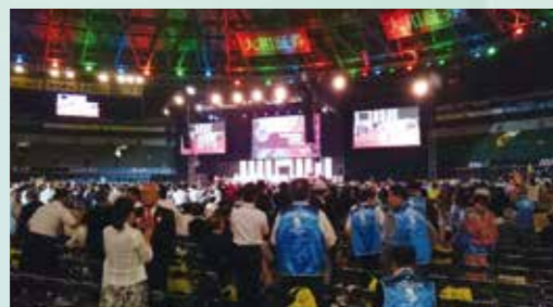
大盛況のヤフオクドーム