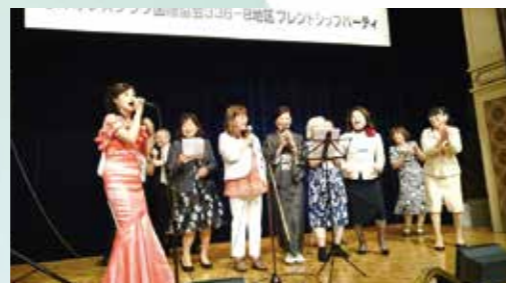
フレンドシップパーティにて女性メンバーが合唱