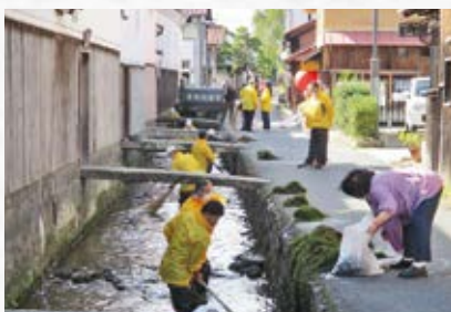
玉川は、旧市街地の重要伝統的建造物

保存地区を流れています。当クラブでは、毎年流しびなを行う川でもあり、春と秋には清掃を行っているところです。