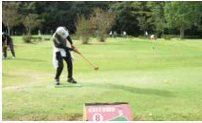
鳥取千代ライオンズクラブ結成40周年