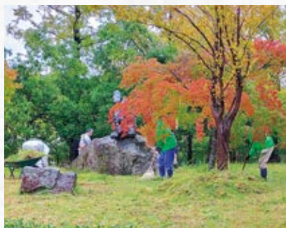
10月の世界ライオンズデーとして、倉

吉市立図書館周辺の除草作業を行いました。当クラブが継続して行ってきた大平山公園環境整備事業が、大平山の造成工事で2025年5月まで利用禁止となっている為、今年度新しいアクティビティとして実施しました。作業開始後、雨が強くなる中、会員はしぶ濡れになりながら、一面茂っていた草を刈りました。図書館の前庭がすっかりきれいになり、紅葉する木々が際立ちました。図書館を訪れる方々が、秋で色づく風景を楽しんで頂きたいと思います。